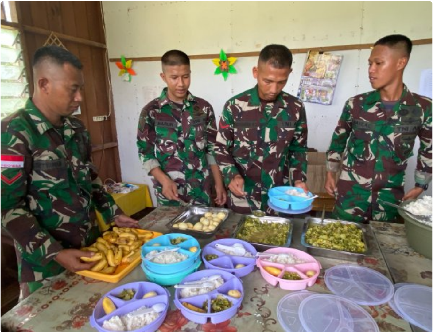
Foto: Dedikasi Satgas Pamtas Mobile RI-PNG Yonif 503/Mayangkara dalam mendukung program makan bergizi gratis pemerintah mendapat apresiasi tinggi dari masyarakat Distrik Krepkuri, Kabupaten Nduga, Papua, di sekolah rimba, Rabu (29/01/2025).